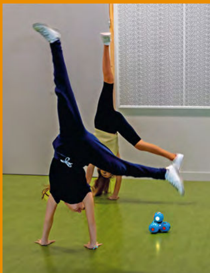
«Danse avec les robots».