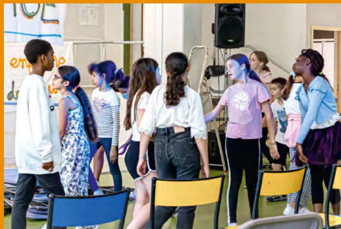
Atelier théâtre enfants.