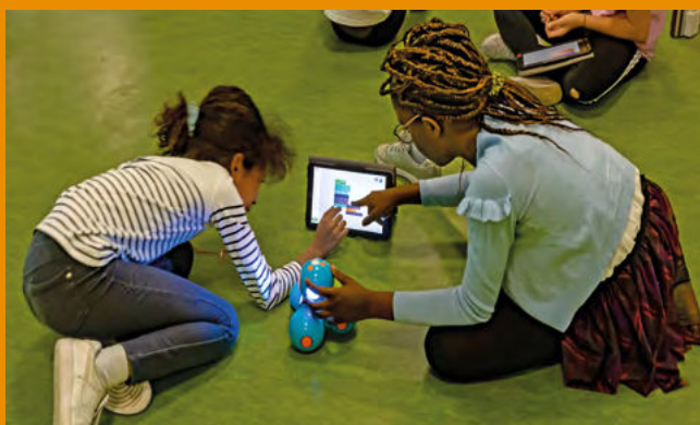
Atelier de codage.

En amont du spectacle, des ateliers THÉÂTRE ENFANTS OU ADULTE sont possibles selon les lieux et dispositifs dans lequel le spectacle se joue. Pour les enfants , l'objectif étant de les faire travailler sur leurs propres revendications de leur quotidien (école, environnement, quartier...). Ils pourraient intégrer éventuellement le spectacle.